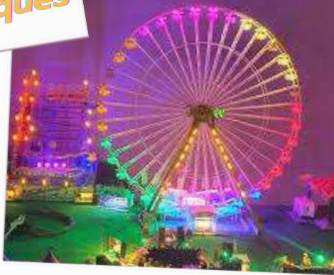
Veillées animées ...